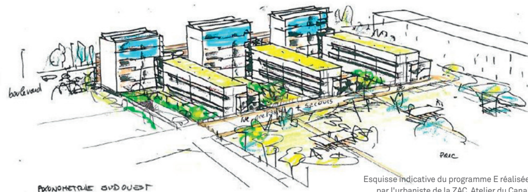
Esquisse indicative du programme E réalisée par l'urbaniste de la ZAC, Atelier du Canal